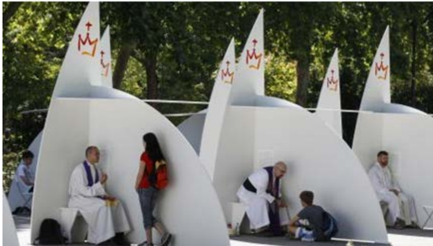
Photo de démarches faites par des jeunes au cours des Journées Mondiales de la Jeunesse

Le sacrement de réconciliation que donne l'Église, chaque fois qu'il est possible, est souhaitable, soit au moment de la prière de libération, soit à un autre moment selon les possibilités.