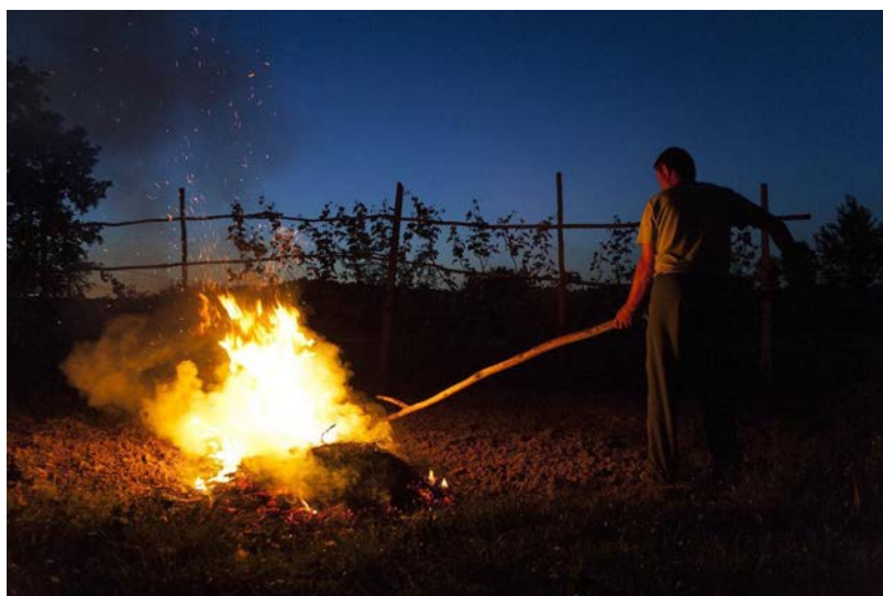
NE JOUONS PAS AVEC LE FEU