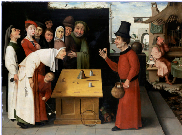
L'escamoteur, Jérôme Bosch, début XVI e