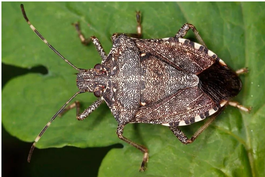
Punaise, dite « diabolique »