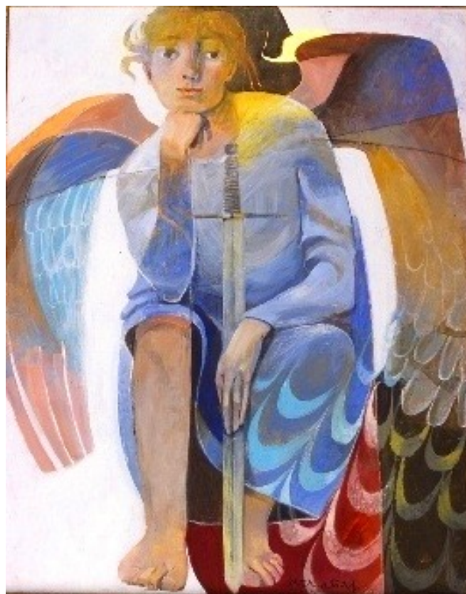
Arcabas. St Michel Archange