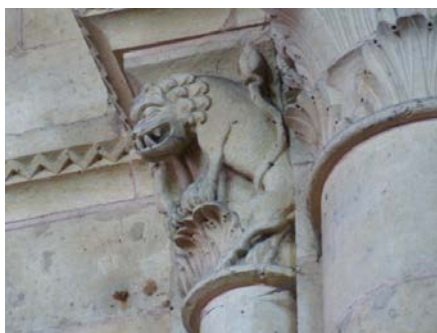
Chapiteau, cathédrale du Mans

Imaginez maintenant, et c'est monnaie courante dans les familles, que le pouvoir de conjuration ou de magnétisme, ou la sensibilité divinatoire... se transmette sur plusieurs générations dans une même famille... vous avez là un pacte étendu aux descendants , sans que ceux-ci n'y soient pour rien. Sauf dans leur acceptation de la transmission (par exemple du pouvoir de conjurer), ce qui équivaut à une initiation.