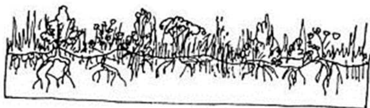
1 SURFACE D'ORIGINE INÉGALE, AVEC PLANTES HERBACÉES, ARBUSTES, GRAMINÉES. LES PLANTES DRESSÉES SONT COUCHÉES SUR LE SOL.