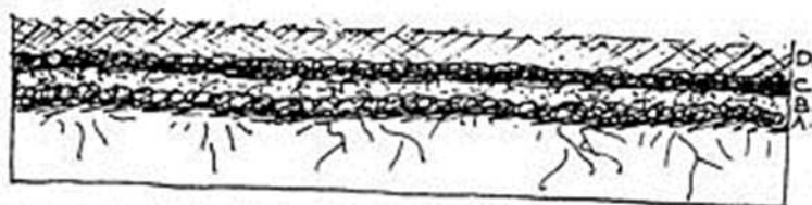
3 A : COUCHES FIGURÉES EN 2. B : 75 MM D'ALGUES, DE RÉSIDUS D'ÉTABLE OU DE FUMIER C : COUCHE - DURE - D'AIGUILLES DE PIN ET D'ALGUES D : COUCHE DE PRÉSENTATION - COPEAUX, ÉCORCE, SCIURE, COQUES, FEVES DE CACAO, BALLE DE RIZ, ETC.