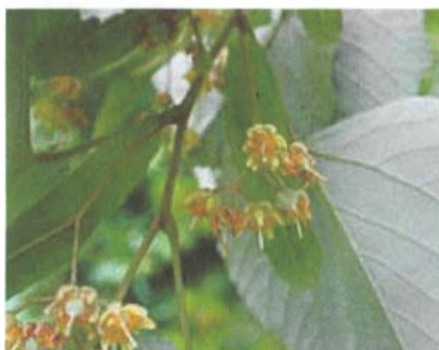
Tilleul à larges feuilles (haut) et Tilleul argenté (bas)

commun ( Tilia x europaea ). Cet hybride est souvent rencontré le long des routes et dans les parcs. Ses fleurs sont pendantes, de 4 à 10 par bractée et apparaissent en été.