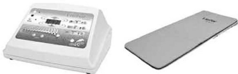
Appareil et matelas magnétique 1,80 m.

En tout cas, les applications et les résultats de cet appareil pour usage particulier sont remarquables y compris dans des pathologies lourdes pour lesquelles la médecine officielle est impuissante.