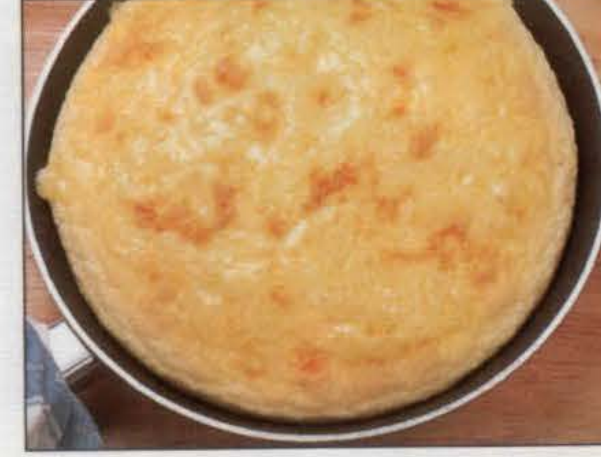
4 L'omelette soufflée est cuite quand elle est gonflée et dorée.