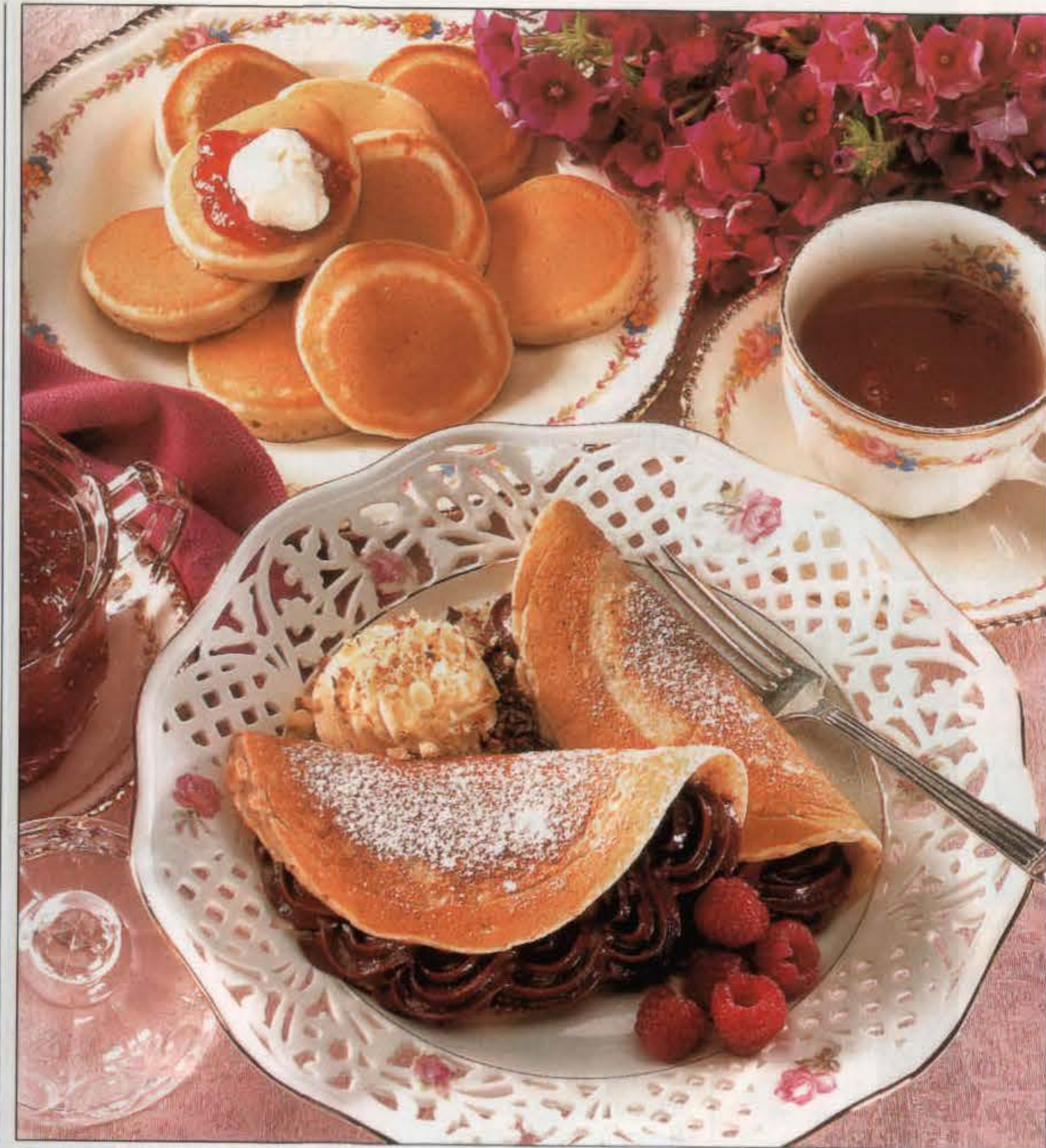
Pikelets (en haut) et pannequets à la noisette fourrés de mousse au chocolat.

3. Pannequets à la noisette : dans une jatte de taille moyenne, tamiser la farine et la levure, puis ajouter le sucre et la poudre de noisette. Former un puits au centre et y verser en une fois les œufs et le lait mélangés. Battre jusqu'à obtention d'une pâte sans grumeaux puis incorporer le beurre. Laisser reposer 10 mn sous un film plastique. 4. Verser 1/4 de tasse de pâte dans une poêle anti-adhésive, légèrement graissée. L'agiter pour