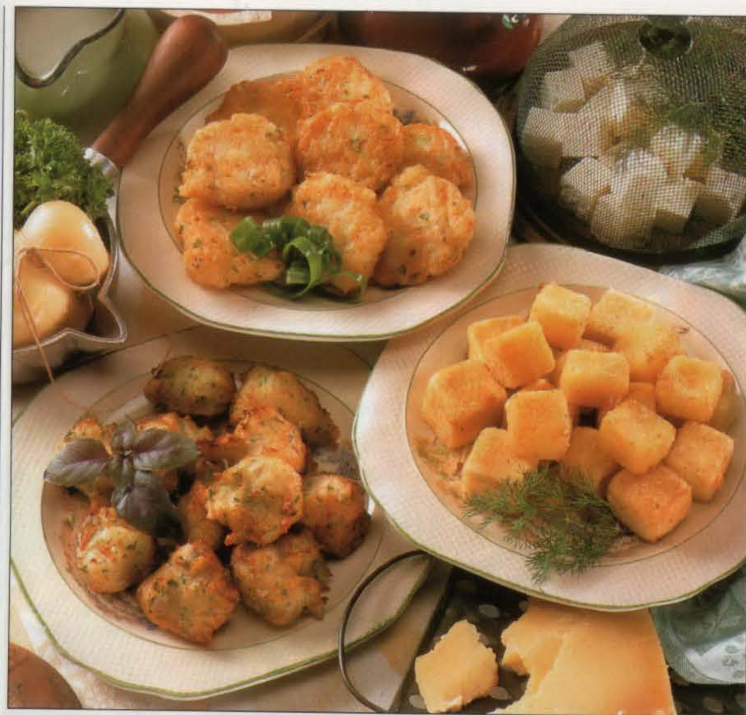
À partir du haut : beignets de crabe et crevettes, dés de fromage panés, beignets au fromage et au persil.

1. Dans une casserole de taille moyenne, chauffer à feu doux l'eau et le beurre en remuant jusqu'à ce qu'il ait fondu. Porter à ébullition.