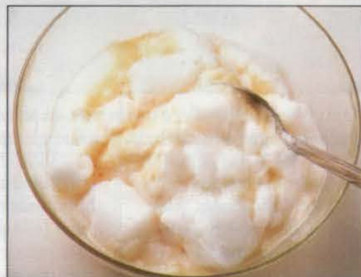
2 Incorporer les blancs en neige avec une cuillère en métal.