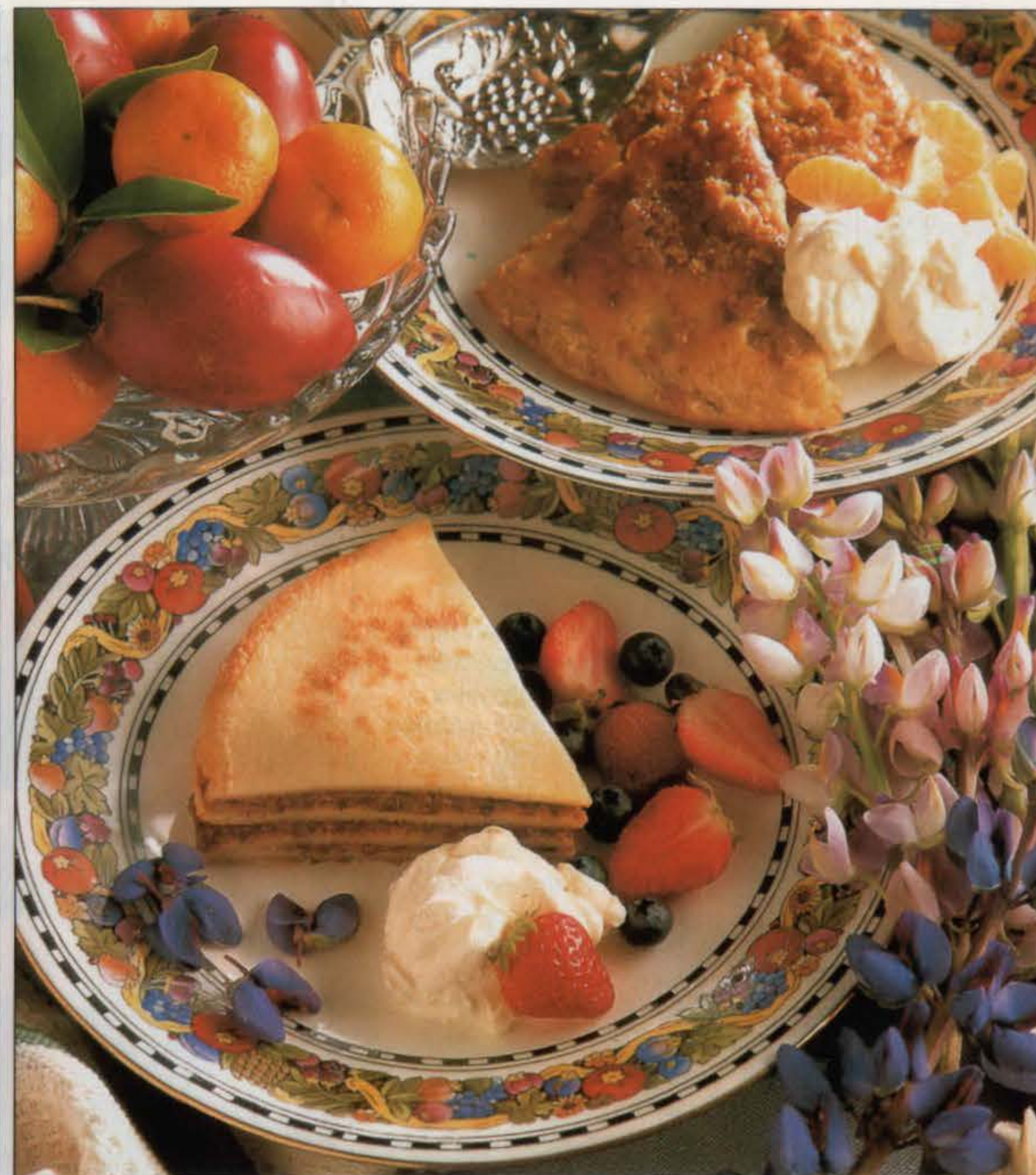
Crêpes caramélisées à la pomme (en haut) et gâteau de crêpes au chocolat et aux noix.

1. Couper la pomme en tout petits morceaux. Les mettre avec l'eau dans une poêle de taille moyenne. Cuire à feu moyen, 8 mn environ, jusqu'à ce qu'ils aient ramolli et que presque toute l'eau soit évaporée. Ajouter le sucre, le jus et le zeste de citron et poursuivre la cuisson, en remuant, pendant 10 mn jusqu'à ce que le tout prenne une couleur caramel. Laisser légèrement refroidir. 2. Dans une jatte de taille