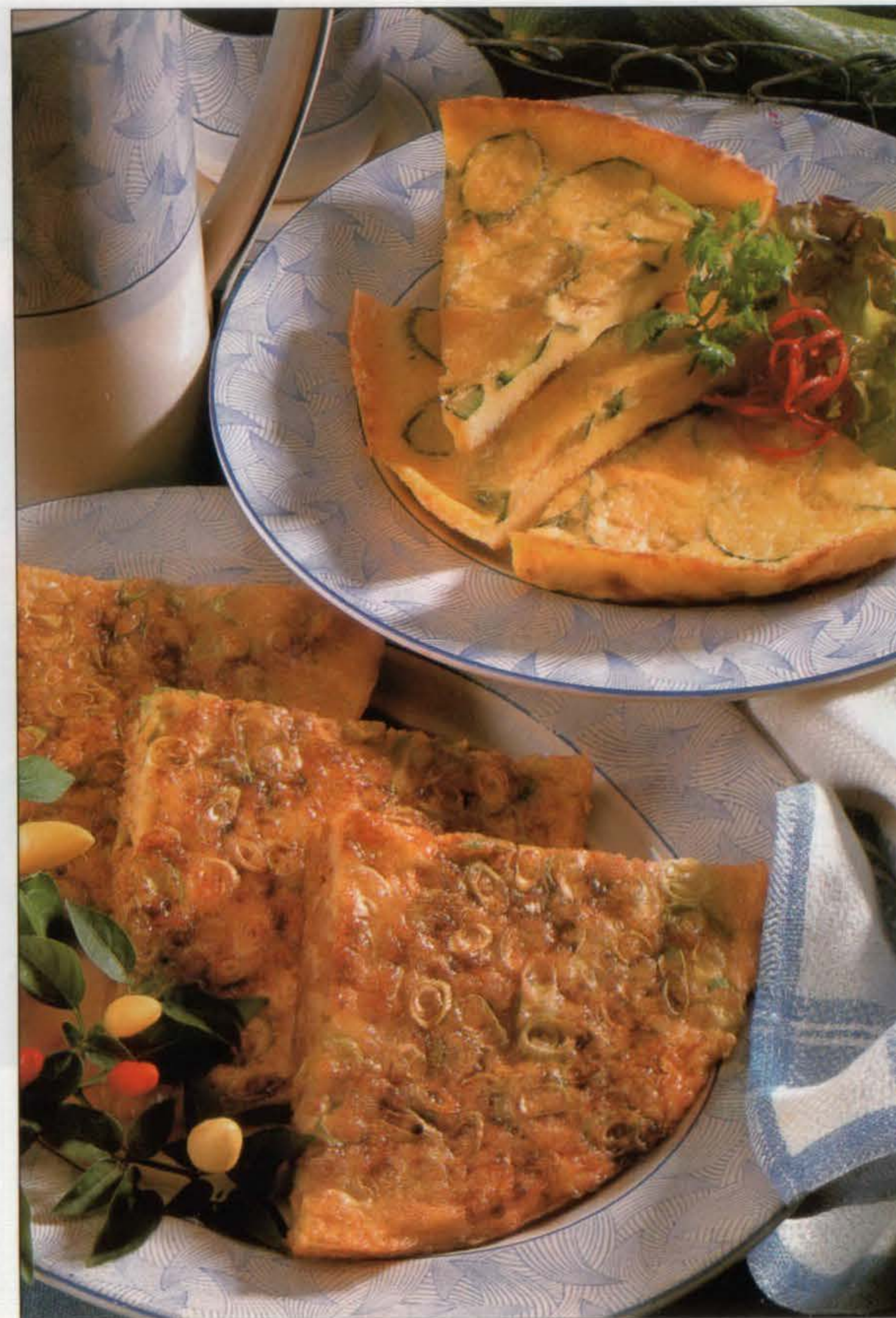
Omelette crémeuse aux courgettes (en haut) et omelette au porc et au gingembre.

Note : pour plus de saveur, râper soi-même un morceau de parmesan.