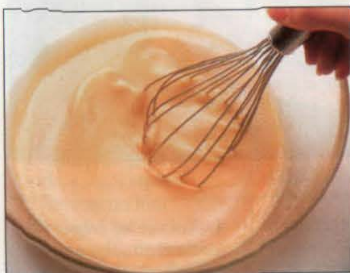
Pannequets au fromage frais et aux cerises.

1. Battre la pâte au fouet métallique jusqu'à ce qu'il n'y ait plus de grumeaux.