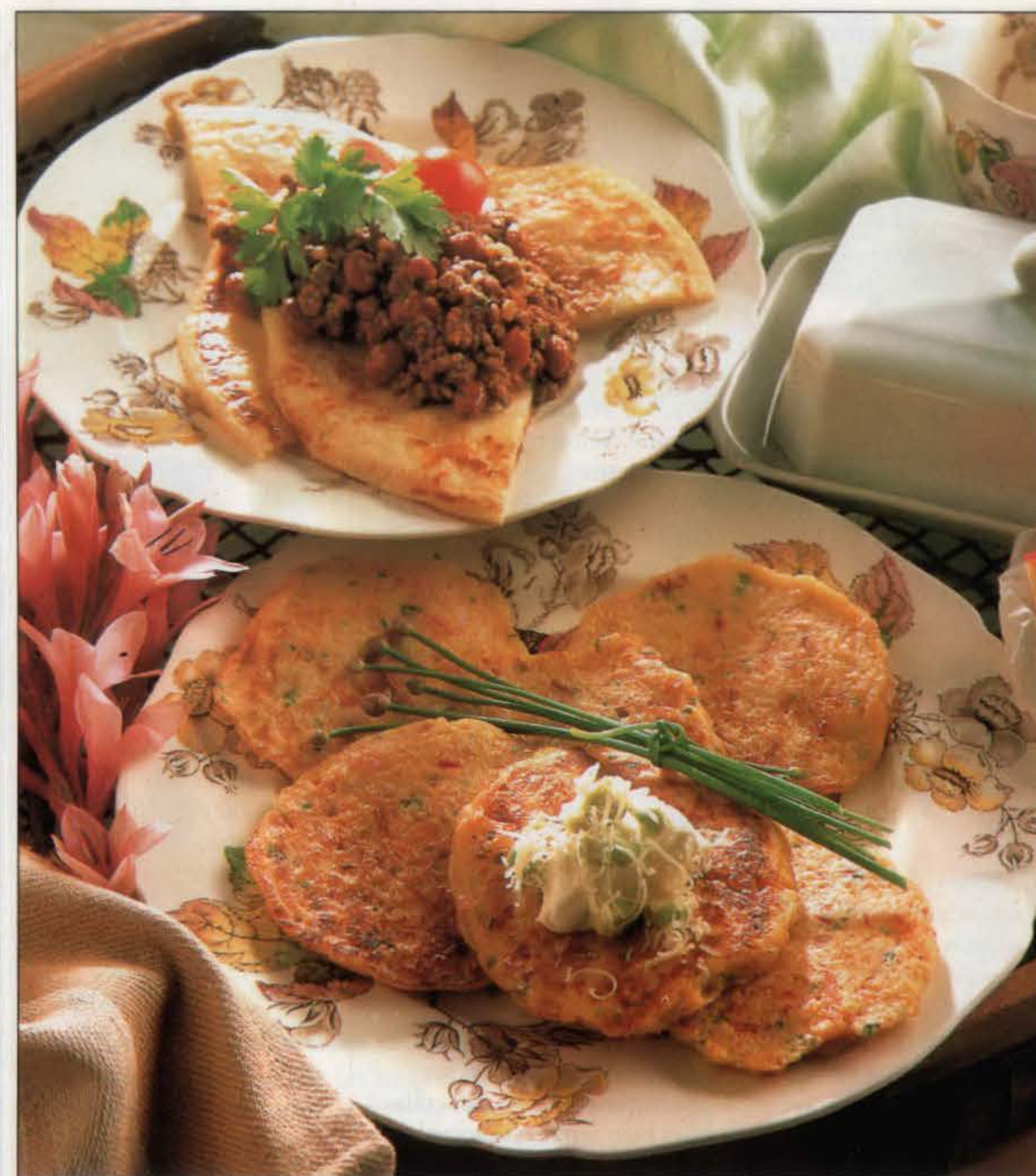
Crêpes au bœuf à la mexicaine (en haut) et crêpes au maïs et au bacon.

1. Tamiser la farine, la levure, le sel et le poivre dans une jatte de taille moyenne et former un puits au centre. Y verser en une fois les œufs et le lait mélangés. Battre le tout jusqu'à ce que le lait soit incorporé et que la pâte ne fasse pas de grumeaux. Ajouter le maïs, le bacon, le parmesan et la ciboulette et bien