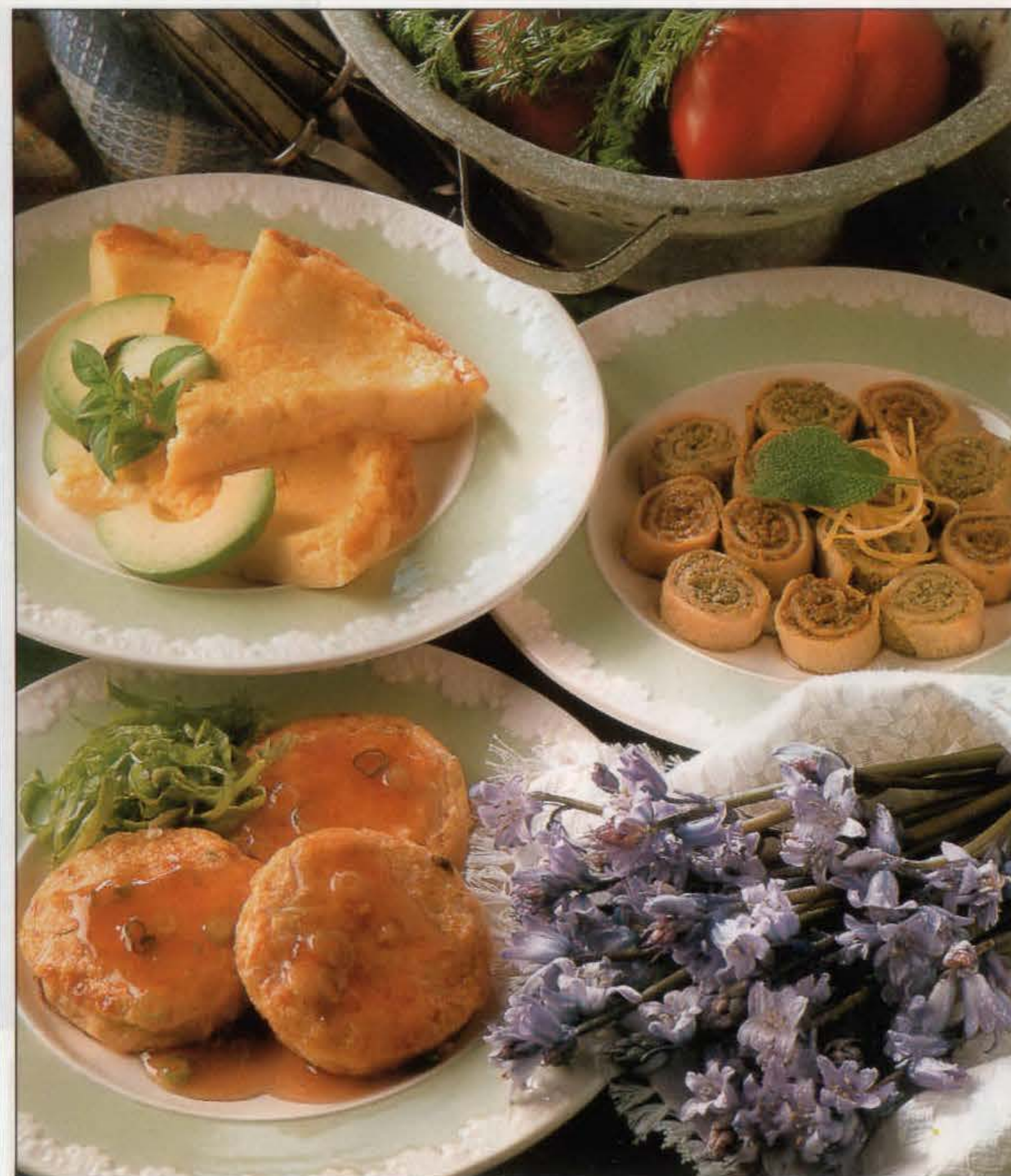
Dans le sens des aiguilles d'une montre, en partant du haut : omelette crémeuse, omelettes roulées parfumées au soja (variantes au pistou et à la tapenade) et petites omelettes aux crevettes.

2. Fondre le beurre, à feu moyen, dans une petite poêle anti-adhésive. Lorsqu'il grésille, y verser le