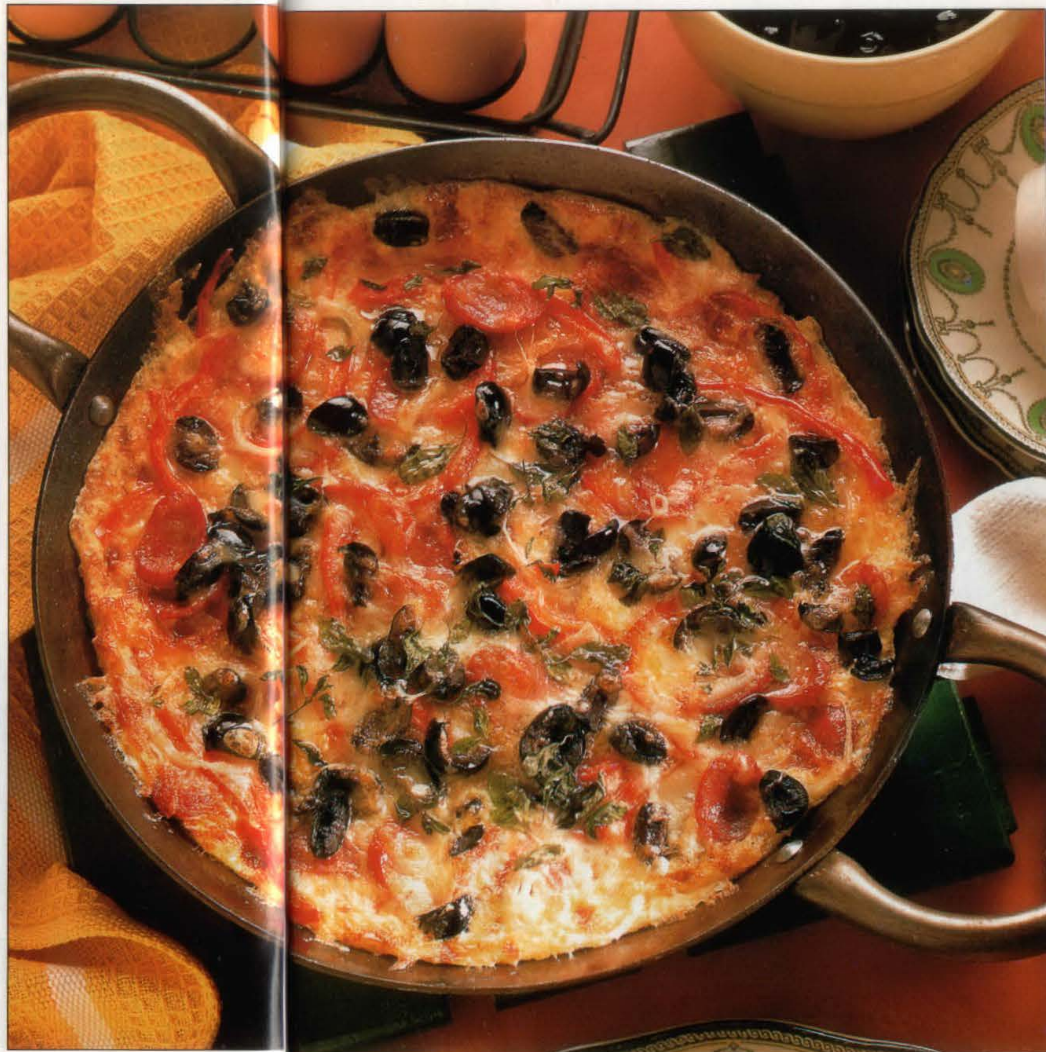
Omelette style pizza.

3. Retirer la poêle du feu et préchauffer le four sur gril. Garnir l'omelette, qui n'a pas fini de cuire, avec l'oignon et le poivron, le fromage, la saucisse et les olives, puis parsemer d'origan.