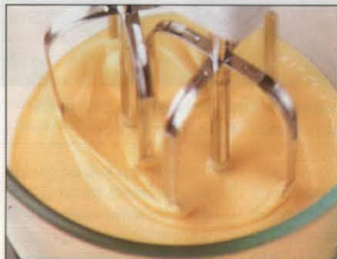
1 Battre la préparation à base de jaunes d'œufs, jusqu'à ce qu'elle soit pâle et crémeuse.