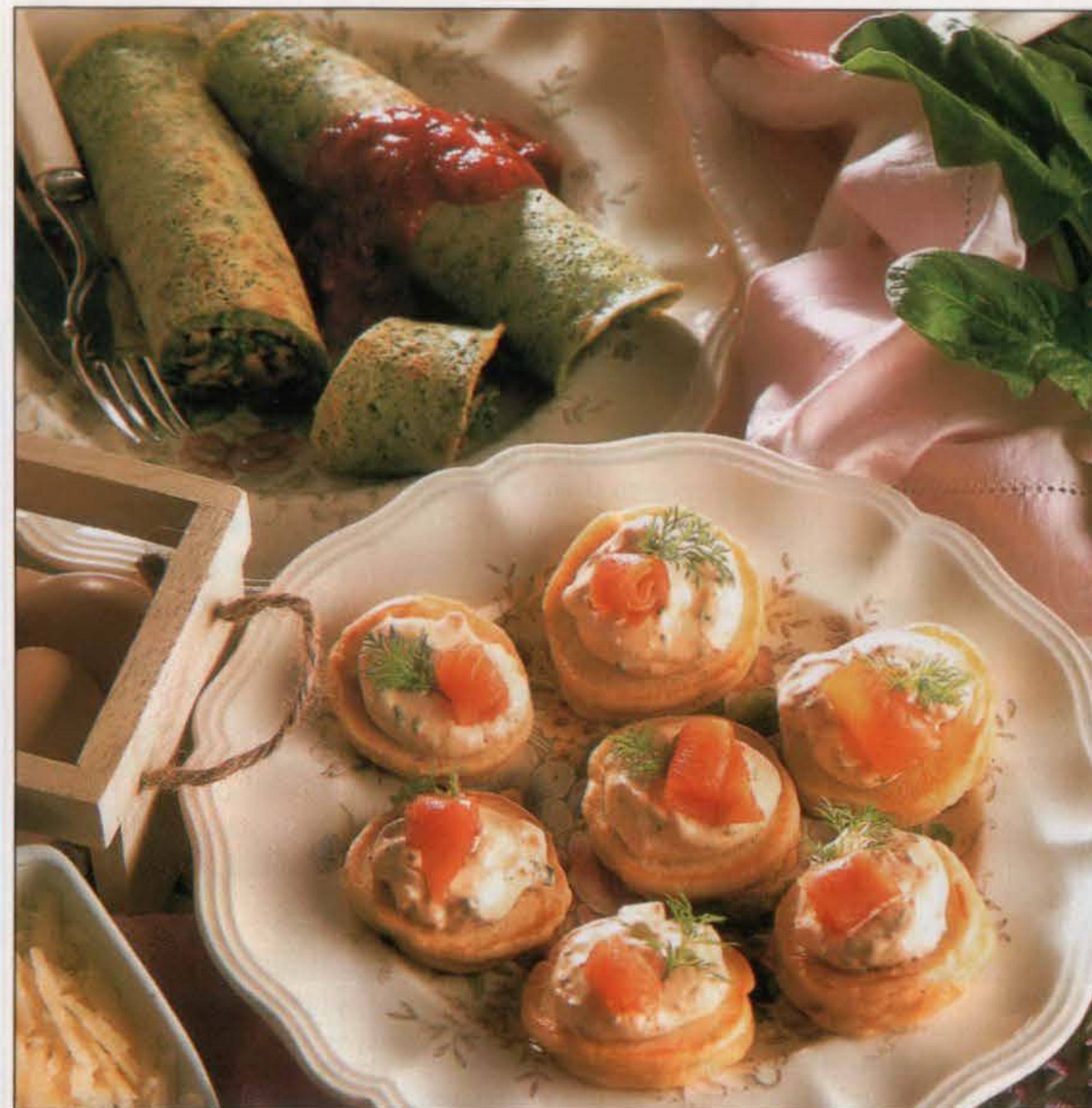
Crêpes fourrées aux épinards (en haut) et blinis garnis de saumon fumé et d'un brin d'aneth.

1. Tamiser la farine, le sel, la levure et le bicarbonate de soude dans une jatte de taille moyenne. Former un puits au centre et y verser en une fois le zeste, le lait, la crème et l'œuf. Battre le tout jusqu'à obtention d'une pâte lisse, sans grumeaux. Couvrir d'un film plastique et laisser reposer 20 minutes. 2. Verser des cuil. à café rases de pâte, en les espaçant de 2 cm, dans une poêle anti-adhésive, légèrement