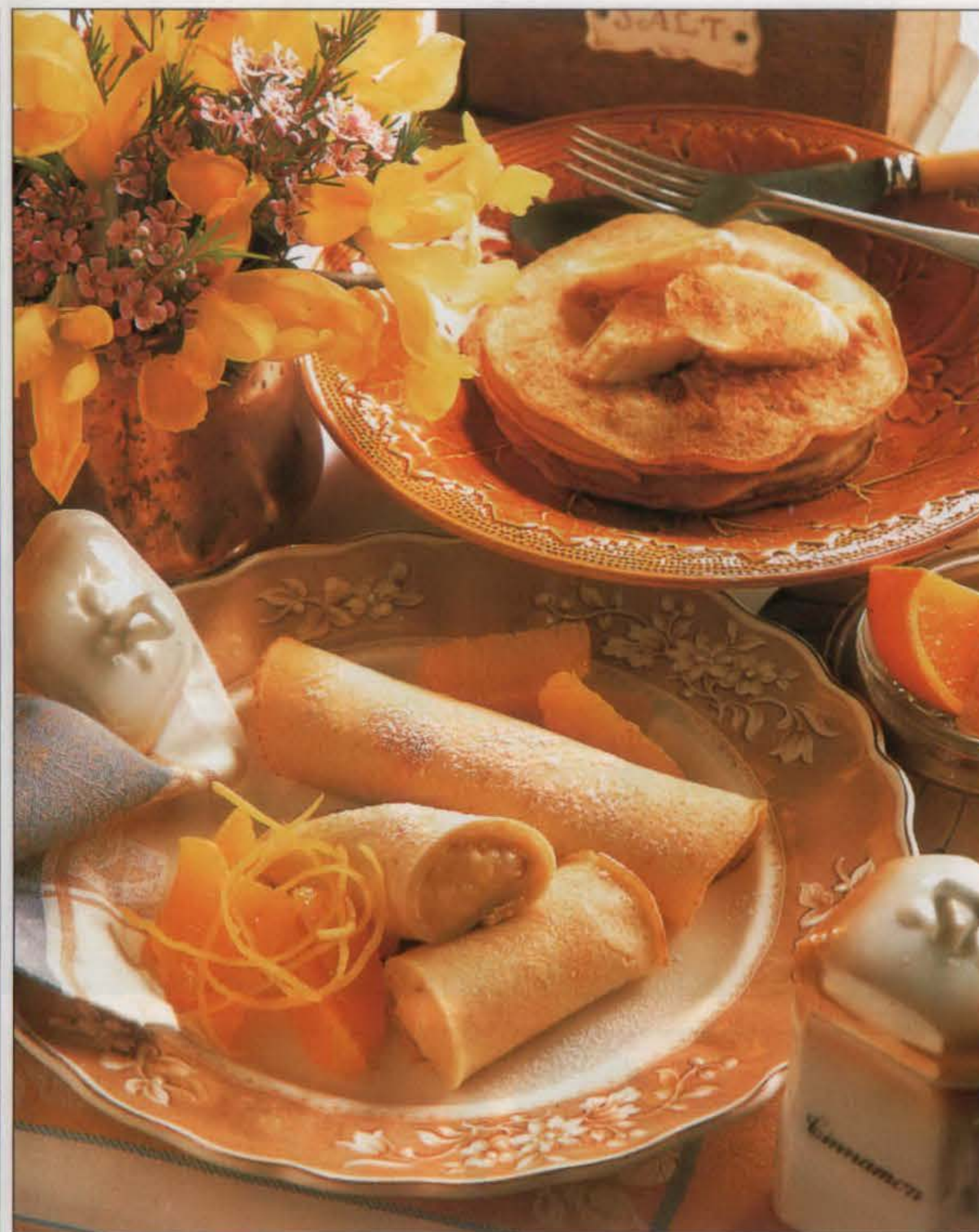
Crêpes à la banane (en haut) et crêpes roulées à la crème anglaise.

1. Incorporer le jus de citron aux bananes écrasées. 2. Mixer grossièrement au robot les flocons d'avoine. Les mélanger à la farine, à la levure, au sucre et au sel dans une jatte de taille moyenne. Former un puits au centre et y verser l'œuf, le beurre fondu et le lait mélangés. Battre jusqu'à obtention d'une pâte sans grumeaux puis y incorporer les bananes