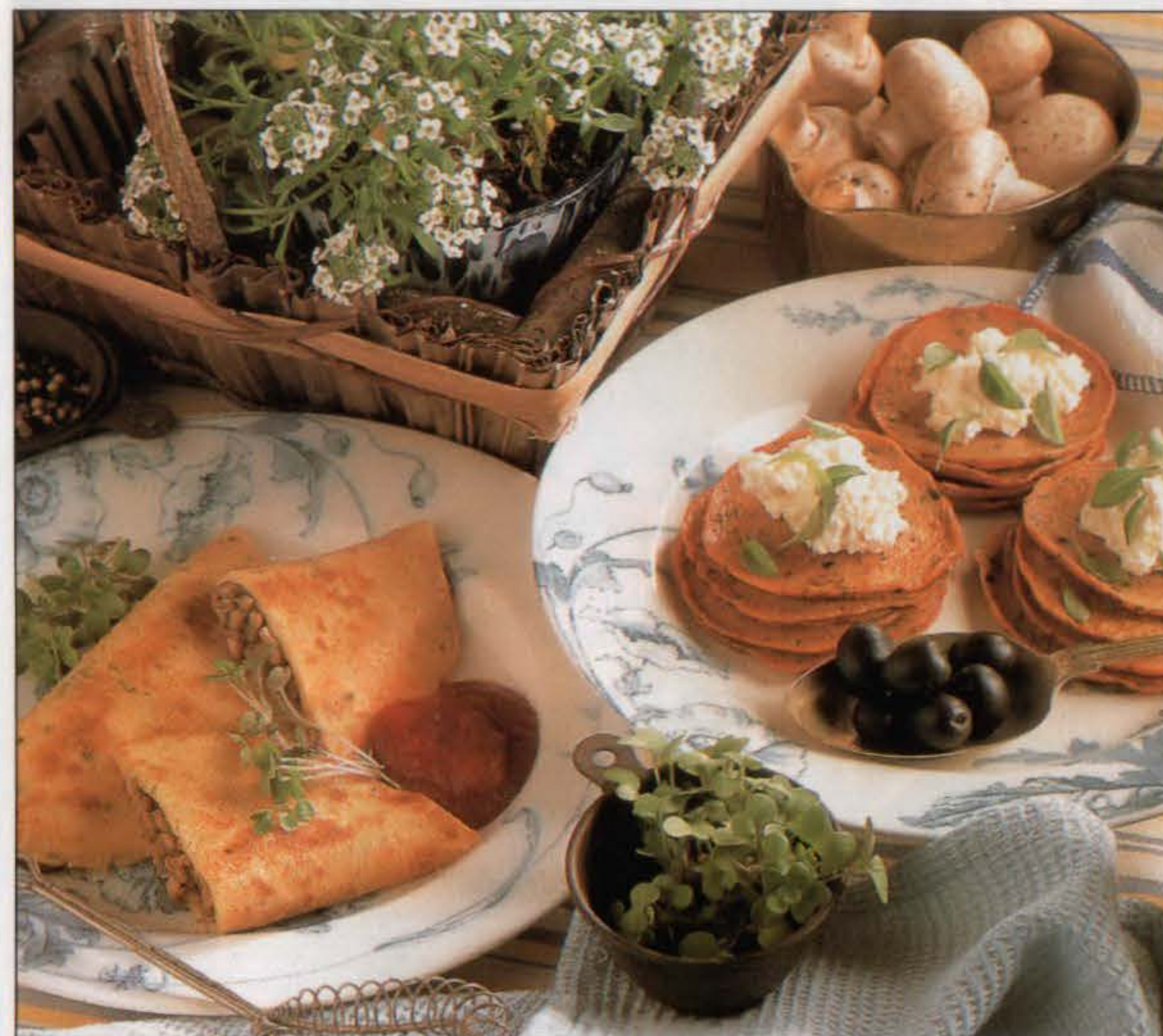
Pannequets croustillants aux champignons (à gauche) et crêpes au poivron et aux olives noires.

1. Couper les poivrons en 2, les épépiner et les aplatir. Les passer au gril 10 mn environ, la peau vers le haut, jusqu'à ce qu'elle cloque et noircisse.