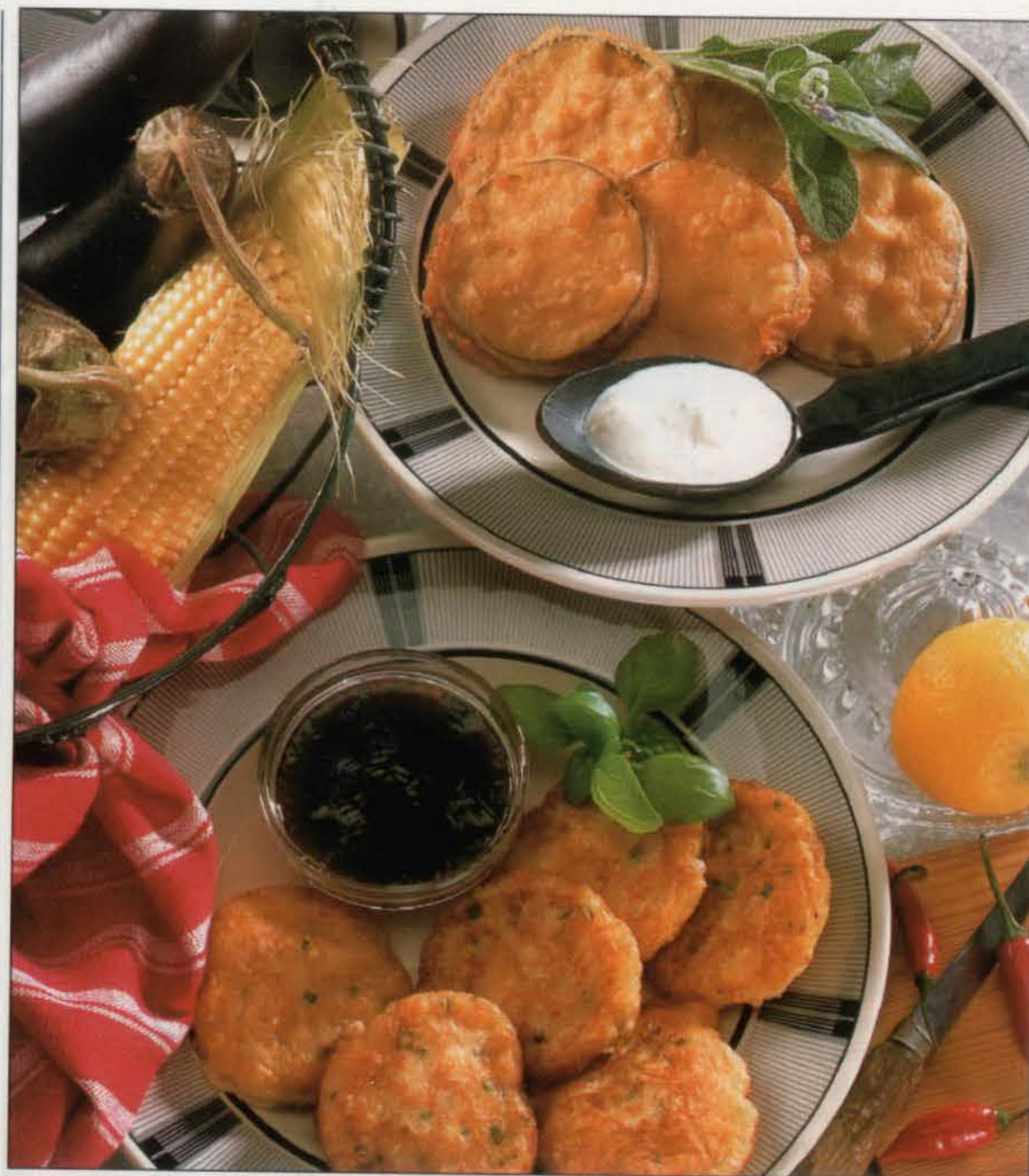
Beignets d'aubergine (en haut) et beignets de maïs.

1. Dans une jatte de taille moyenne, tamiser la farine avec la levure, la coriandre et le cumin. Former un puits au centre et y verser en une fois le maïs (en grains et en purée), le lait, les œufs, la ciboulette, le sel et le poivre. Bien mélanger afin d'obtenir une pâte sans grumeaux.