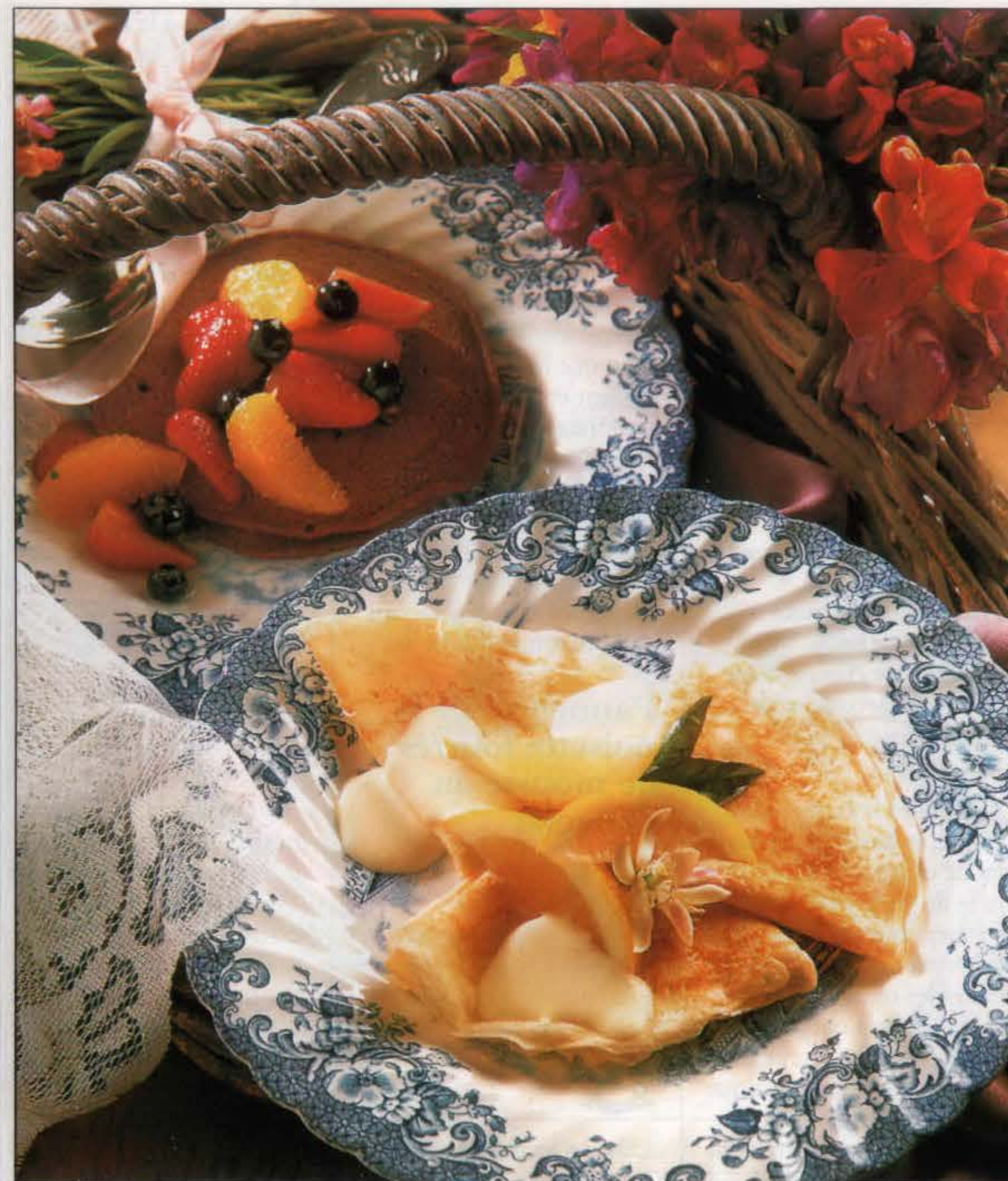
Crêpes chocolatées avec fruits à la liqueur (en haut) et crêpes à la crème au citron

1. Mixer au robot ou au mixeur la farine, le sucre, le beurre et l'essence de vanille, pendant 15 secondes pour obtenir une pâte sans grumeaux. La mettre dans une jatte, couvrir d'un film plastique et la laisser reposer 10 mn. 2. Verser 2 à 3 cuil. à soupe de pâte dans une crêpière ou une poêle anti-adhésive de 20 cm. L'agiter pour en tapisser le fond uniformément. Chauffer la crêpe 30 secondes à feu moyen pour dorer le