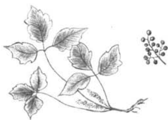
herbe à puce et fruits