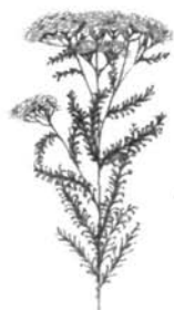
herbe à dinde

Couper le bœuf en cubes et faire bouillir un moment à feu vif dans un peu d'eau. Presser la viande dans le bouillon pour en extraire le jus. Saler et poivrer. Boire chaud, plusieurs fois par jour.