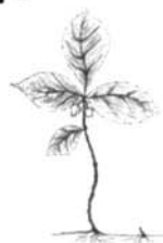
thé des bois ou wintergreen

Faire bouillir quelques minutes les feuilles et les petits grains rouges de wintergreen dans un peu d'eau. Couler et sucrer au goût. Prendre au besoin.