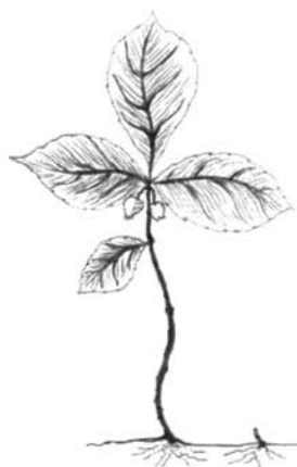
thé des bois ou wintergreen