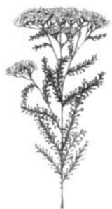
herbe à dinde