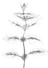
menthe du Canada

Les personnes qui ne se lavaient pas attrapaient des poux de corps. Ceux-ci étaient plus gros et plus foncés que les poux de tête. Ils se logeaient dans les combines 34 de laine. Souvent pour s'en débarrasser, on devait se clipper 35 le corps partout et ébouillanter les combines. «J'ai entendu dire que la fièvre pouvait causer des poux. Je ne le sais pas. Les poux de tête n'étaient rien à comparer aux poux de corps.»