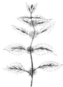
menthe du Canada