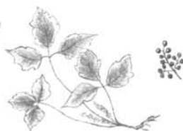
herbe à puce et fruits

A près un contact avec l'herbe à puce, se laver avec de l'eau chaude et du savon de pays. On dit que l'huile secrétée de la plante est responsable des démangeaisons.