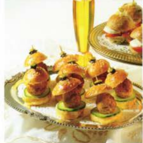
52- Batbot au fromage et au jambon