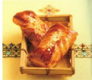
26- Brioche au chocolat et raisins secs