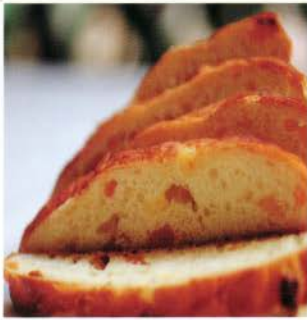
48- Pains aux amandes et raisins secs