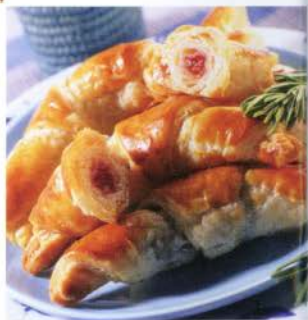
crème d'amandes et raisins secs